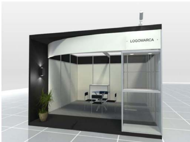
Básico – meio